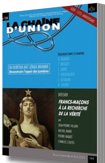
Abonnement à La Chaîne d'Union 4 numéros par an