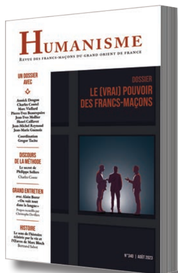
Abonnement à Humanisme 4 numéros par an

E-mail : ea.conform@orange.fr ou Tel. : 01 48 07 55 87