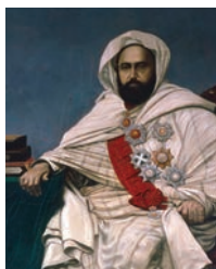
Emir ABD EL-KADER