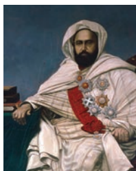
Emir ABD EL-KADER