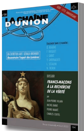
Abonnement à La Chaîne d'Union 4 numéros par an