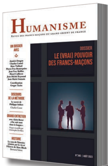
Abonnement à Humanisme 4 numéros par an

E-mail : ea.conform@orange.fr ou Tel. : 01 48 07 55 87