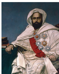
Emir ABD EL-KADER