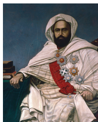
Emir ABD EL-KADER