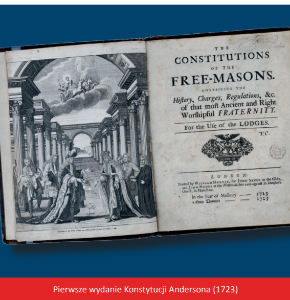
Pierwsze wydanie Konstytucji Andersona (1723)

„Uczyć się o sobie, uczyć się od innych i jego różnic, we wspólnym ideale republikańskim”